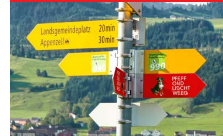
Pfeff ond Lisch Weeg