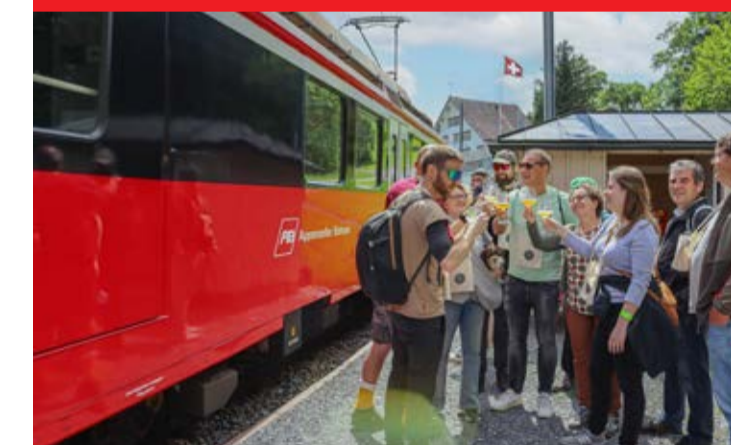
Bier & Gnuss a dä Zahradbahn