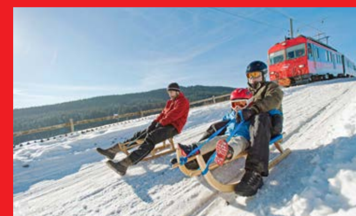
Schlittenspass am Stoss